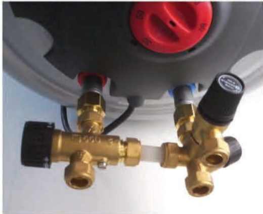
LK Armatur varolaiteryhmä termostaattisella sekoitusventtiilillä